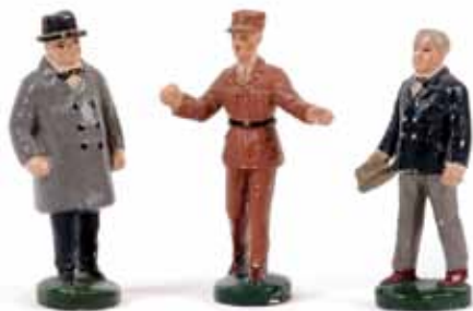
LOT 57, 58, 59