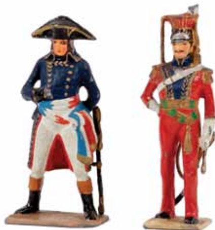
LOTS 61 & 62